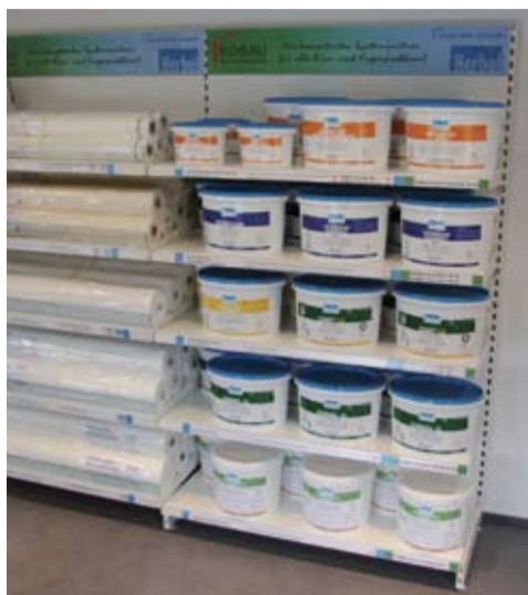
Die übersichtliche Lösung: Vlies und die passende Beschichtung auf einen Blick.

Kooperation Herbol und Kobau jetzt mit neuem Verkaufsregal im Handel