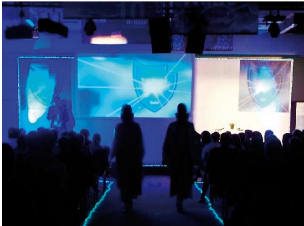
Ein Hauch von blauer Magie: Die Weltpremiere von Herbol-Symbiotec™ verzauberte die anwesenden Maler.

Präsentation der echten Nano-Fassadenfarbe auf dem InForum des Herbol-Fassaden-Schutzbrief