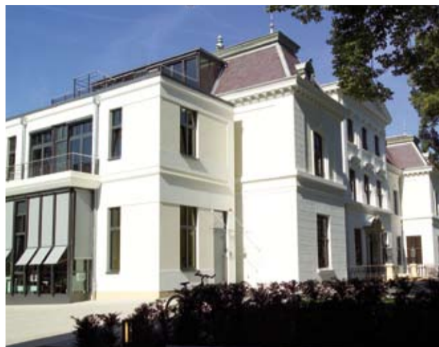
Das Farbkonzept sieht drei dezente Farbtöne vor.

des Haupthauses inklusive Sockel saniert und 450 m 2 Fassade der neuen Anbauten erstmalig beschichtet. Die alte Beschichtung wurde mit Feuchtsandstrahl entfernt. Der Auftraggeber hatte zwar Abbeizen vorgesehen, man entschied sich jedoch wegen der Umweltproblematik (Ausdünstungen, Gefahrgut) anders. Außerdem hätte der einsetzende Winter mit zu erwartenden Temperaturen unter 0 °C das Abbeizen erschwert. Ein weiterer Vorteil des Abstrahlens: Die Farbschlacke konnte aufgefangen und kontrolliert entsorgt werden. Durch das Sandstrahlen wurden auch lose Putzteile entfernt. Da der Oberputz von guter Qualität war, blieben die Abgänge minimal. Aus Kostengründen entschied man sich gegen einen Streichfüller und für die Betonsanierung größerer Ausbrüche. Deshalb griff man zum Herbol-Universal-Fassadenputz: „Die Betonsanierung bedeutete geringere Kosten bei Material- und Arbeitseinsatz, und das Ergebnis war dennoch so, wie wir es haben wollten“, berichtet Wolfgang Müller.