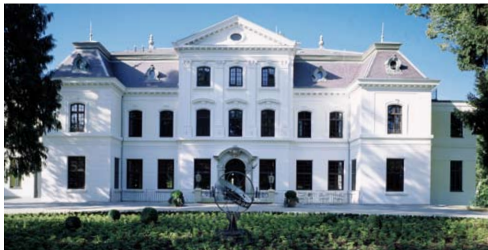
Das Herrenhaus Wellingsbüttel ist heute ein „Alsterdomizil“ für betreutes Wohnen mit einem herrlichen Park.

Das Herrenhaus Wellingsbüttel wurde im Winter renoviert – mit Silikatfarben von Herbol