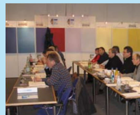
Die Herbol-Verkaufsberater absolvierten den TÜV-Lehrgang über Schimmelpilze.

Zum Nachweis der Schulung legten die Teilnehmer beim TÜV Rheinland eine Prüfung ab. Jeder Herbol-Verkaufsberater erhielt ein Zertifikat vom TÜV, das die erworbenen Kenntnisse über „Schimmelpilze in Innenräumen“ bestätigt. Als sachkundiger Experte wird der Herbol-Verkaufsberater jetzt quasi zum „Gebäudepathologen“, der die Veränderungen in der Bausubstanz oder unangemessenes Lüftungsverhalten diagnostiziert sowie professionelle Sanierungsverfahren vorschlägt. Sollten Sie Fragen zu diesem Thema haben, sprechen Sie einfach Ihren Herbol-Verkaufsberater an.