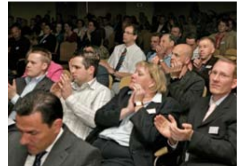
Die Maler waren begeistert und applaudierten.

Bis Januar 2008 wird die Nano-Fassadenfarbe exklusiv von den lizenzierten Malerbetrieben des Herbol-Fassaden-Schutzbrief verarbeitet. Sie werden zu Nano-Innovationsbetrieben, die sich einen Wettbewerbsvorsprung sichern!