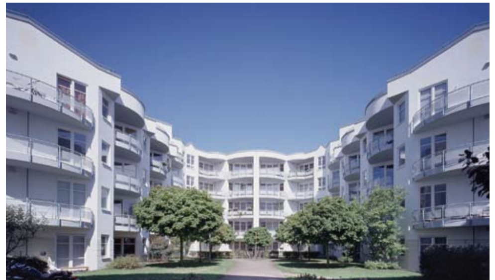
Die Sanierung des Wohnobjekts umfasste 12.000 m² Fassaden- und 2.500 m² Fensterfläche.